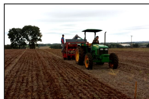
Equipe Biotrigo - semeadura do ensaio

Para a maioria dos casos, acreditamos que a faixa de velocidade que proporciona uma melhor combinação entre velocidade e eficiência do plantio situa-se entre 4 à 6 km/h.